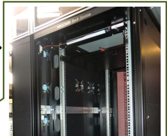
冷気の吸入はラックパネル面上前面から上側面から熱の排気をアシストします。