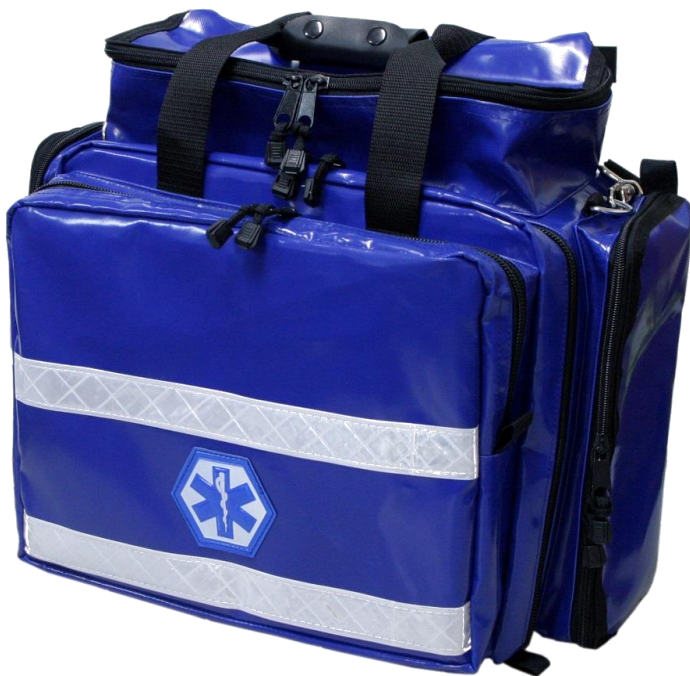
WJK-1C 定価: ¥36,000- (税抜)