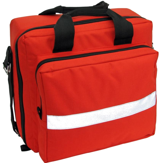
A-900 定価 ¥40,000- (税抜)