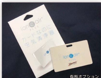
イオニアカード (清浄範囲 半径1.5m)