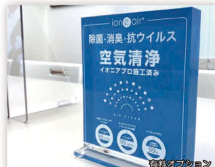
アクリル盾 (清浄範囲 半径2m)